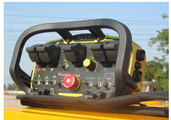
Radiocomando Radio remote control Télécommande Mando a distancia Fernbedienung Пульт радиоуправления