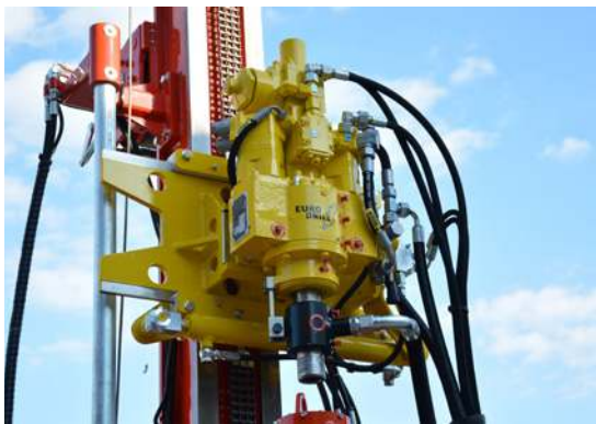
Testa roto-percussione Hydraulic drifter Tête roto percussion Hydraulikhammer Cabeza con martillo hidráulico Гидроломолот