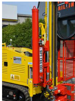
Penetrometro SPT SPT penetrometer Pénétrmètre SPT SPT penetrationsmesser Penetrometro SPT Пенетрометр SPT